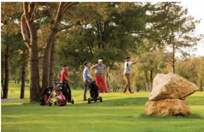
Karolinka Golf Park (recepja: ul. Lotnicza 4, czynna w sezonie: pon.-pt.: 9:00-20:00, sob.-nd.: 8:00-20:00, kontakt: +48 537 677 000)