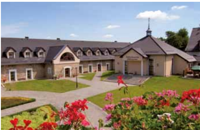
Sebastianeum Silesiacum (recepcja czynna w godz. od 7:00 do 22:00 – w niedziele i święta od godz. 8:00, ul. Parkowa 1B, wjazd od strony ul. Bronisławy/1 Maja)