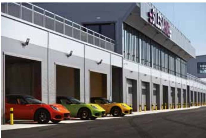
Tor wyścigowy Silesia Ring (recepja: ul. Lotnicza 5-7, czynna od pon.-pt. w godz.: 8:00-16:00, kontakt: . +48 691 017 555)