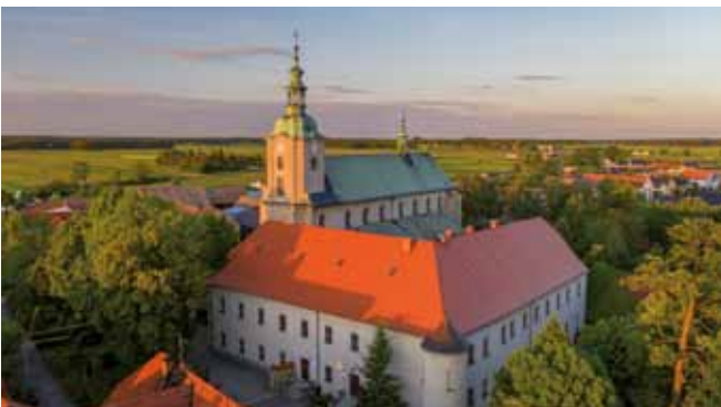
Kościół pw. Wniebowzięcia Najświętszej Marii Panny i klasztor pocysterski z XIII w.