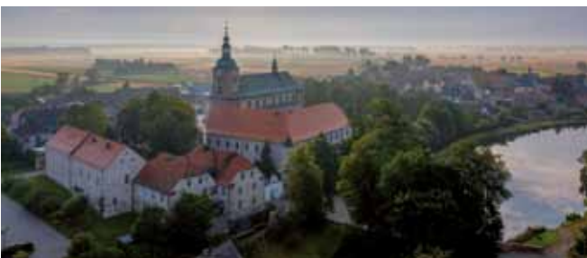
Widok z lotu ptaka