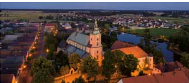
Zabytkowa ul. Wiejska