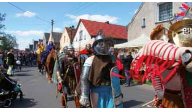
Jarmark Cysterski, parada rycerska